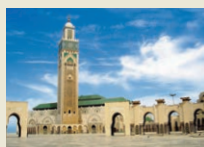
Casablanca Grosse Moschee Hassan II.