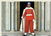
Rabat Königspalast von Mohammed VI.