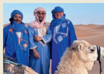
Merzouga Wüsten-Erlebnis vom Feinsten.