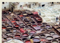
Fès Besichtigung des einzigartigen Souks mit Färber- und Gerberviertel.